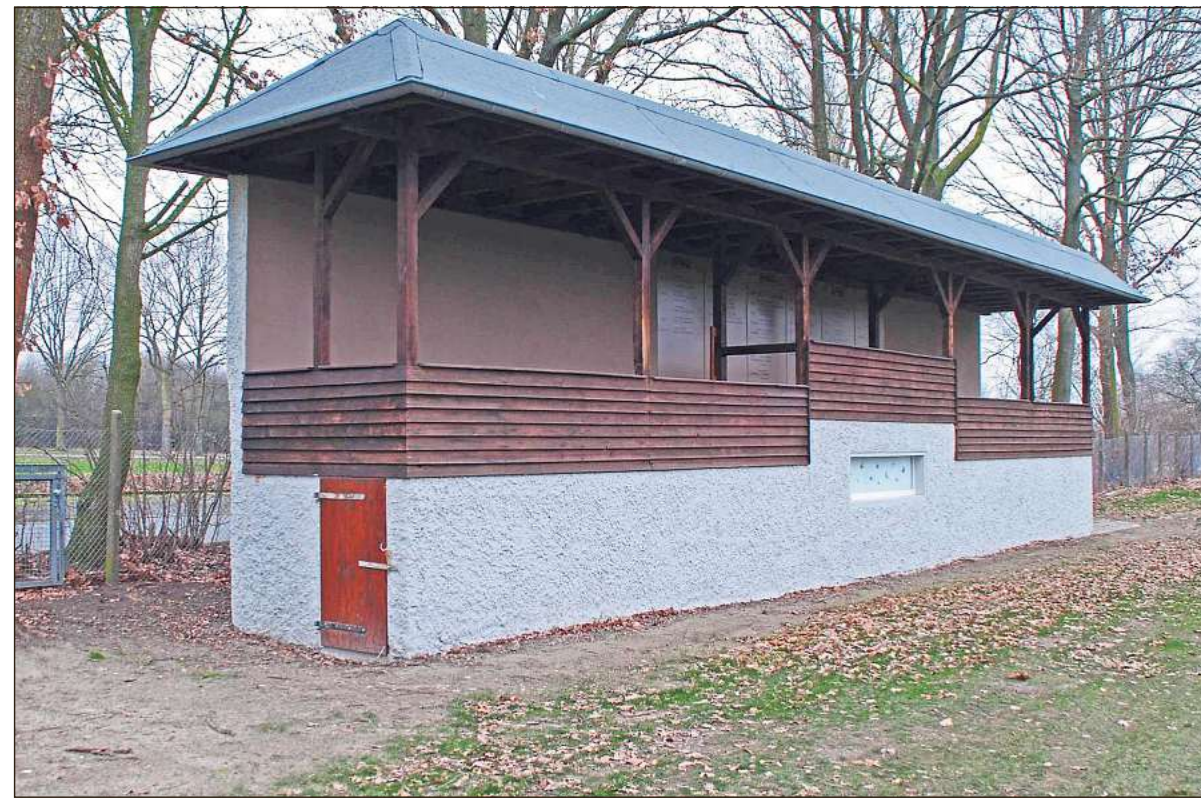
Preisrichtertribüne nach der Restaurierung: Als Austragungsort für Reitturniere diente ein in Ostenfelde nach dem Zweiten Weltkrieg neu errichteter Turnierplatz, zu dem auch eine Preisrichtertribüne gehörte, die der LWL unter Denkmalschutz stellte.

Auf Anregung des „Arbeitskreises Dorfgemeinschaft Ostenfelde“ und bestätigt durch ein Gutachten der LWL-Denkmalpflege, Landschafts- und Baukultur in Westfalen wurden Turnierplatz und Tribüne 2016 in die Denkmalliste eingetragen.