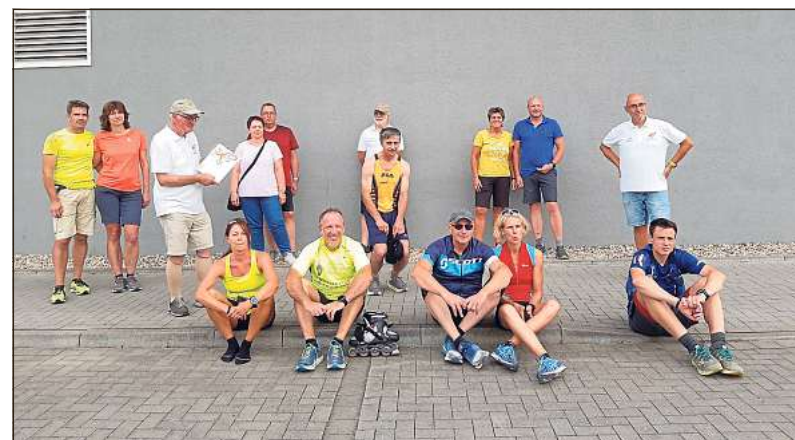
Mehr als 1000 Euro haben die Initiatoren des inoffiziellen Münsterland-Sternlaufes gesammelt.